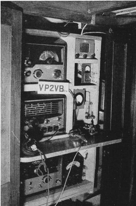
La cabine Radio