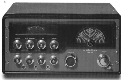
TX Hallicrafter HT-32