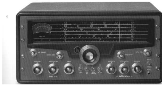
RX Hallicrafter SX-101