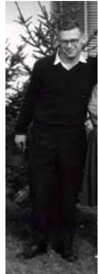
« F7GX »

En 1947, l'armée de terre américaine (US-Army) dispose de ses premières bases permanentes, qui sont installées à Paris, Fontainebleau, Orléans, Poitiers et Verdun ; la marine américaine (US-Navy) contrôle le port de Cherbourg, et divers camps retranchés maritimes, objet d'un régime spécial du fait de leur importance militaire (La Rochelle/La Palice, Saint-Nazaire, Biarritz, Marseille, Cannes, Nice...) ; l'aviation américaine (US-Air Force) dispose des bases de Bordeaux/Mérignac, Orly, Evreux, Châteauroux, Toul, Laon, Phalsbourg, Chaumont et Etain.