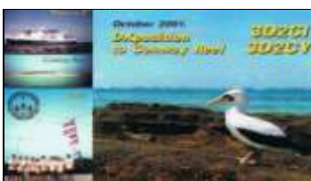
Conway Reef (2001) OC112