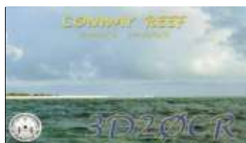
Conway Reef (2009) OC112