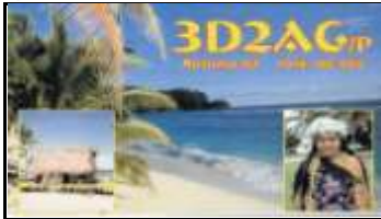
Rotuma Isl. OC060