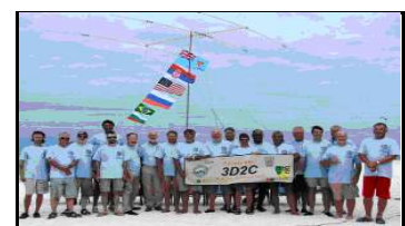
Conway Reef (2012) OC112