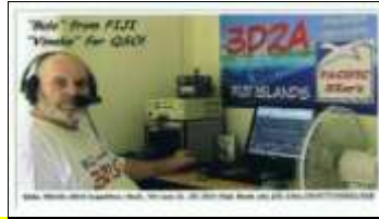
Levu Isl. OC016