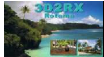
Rotuma Isl. OC060