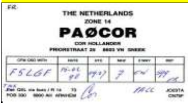
FR - Friesland