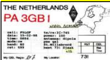
NB - Noord Brabant