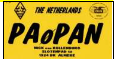
FL - Flevoland