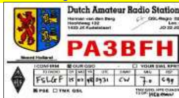
NH - Noord Holland