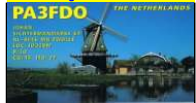
OV - Overijssel