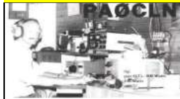
GR - Groning