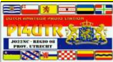
UT - Utrecht