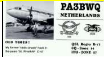
ZH - Zuid Holland