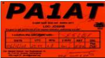
DR - Drenthe

Nota : L'abréviation des provinces figure généralement dans la QSL