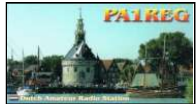
LM - Limburg